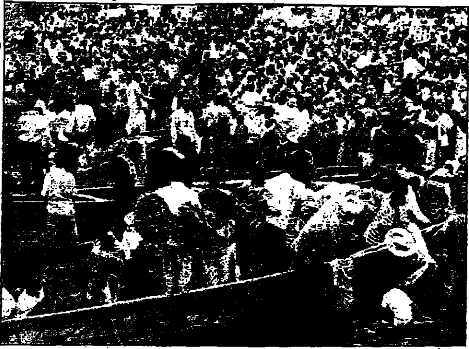
الان المواطنين في زانير يهربون من القتال بالزوارق